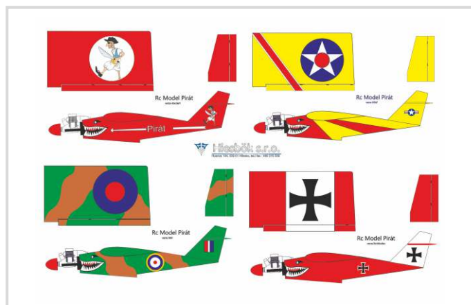
Variální barevná provedení modelu letadélka Pirát

Proč a jak však začal Rudolf Hiesbök s návrhy modelů? Jak je vlastně začal navrhovat? Na kreslicím prkně, tužkou a pravítkem, nebo už použil nějaký počítačový program?