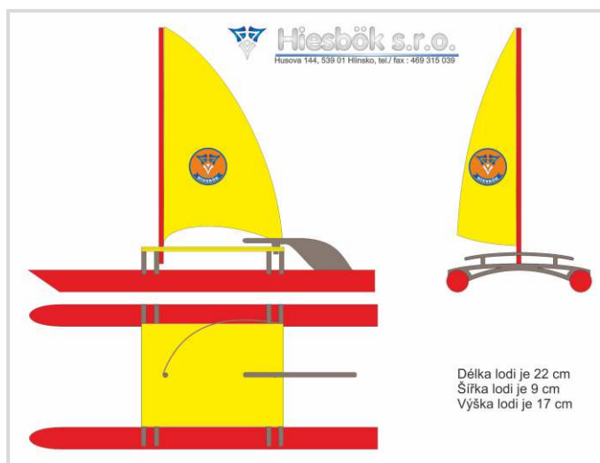
Schématický nákres modelu katamaránu

Za třetí, díky tomuto softwaru jsem dosáhl se svými výrobky mnoho životních úspěchů. Například šest medailí za naše výrobky na mezinárodním veletrhu model hobby v Praze.“ CorelDRAW® Graphics Suite tedy „do puntíku“ naplňuje potřeby podnikání jeho firmy. „Nehledám jiný software, není tomu totiž potřeba,“ stojí si za svým Rudolf Hiesbök.