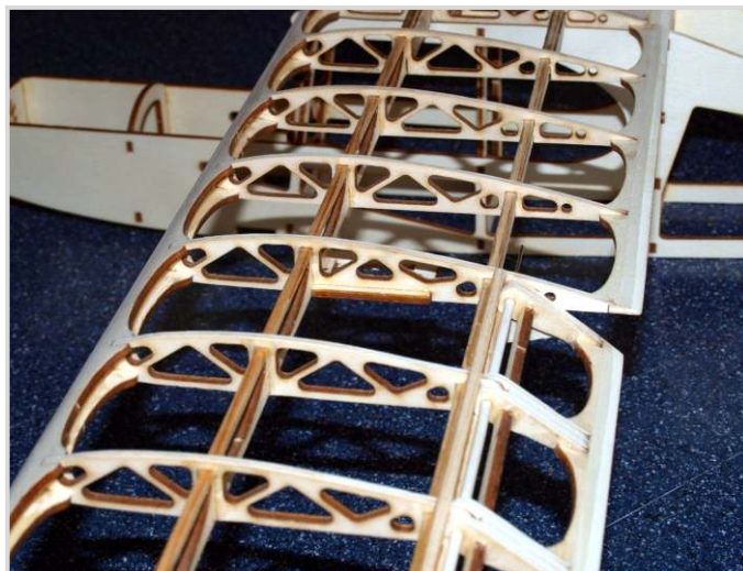
Model letadélka Marabu